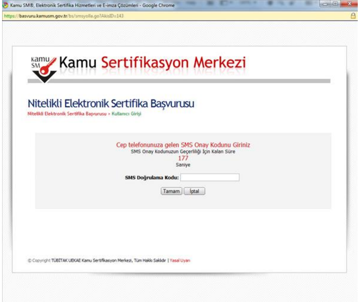
Şekil 6: Başvuru SMS Onayı

Cep telefonuna gelen SMS Onay Kodu ilgili yere girilmeli ve "Tamam" butonuna basılmalıdır (Bkz. Şekil 6).