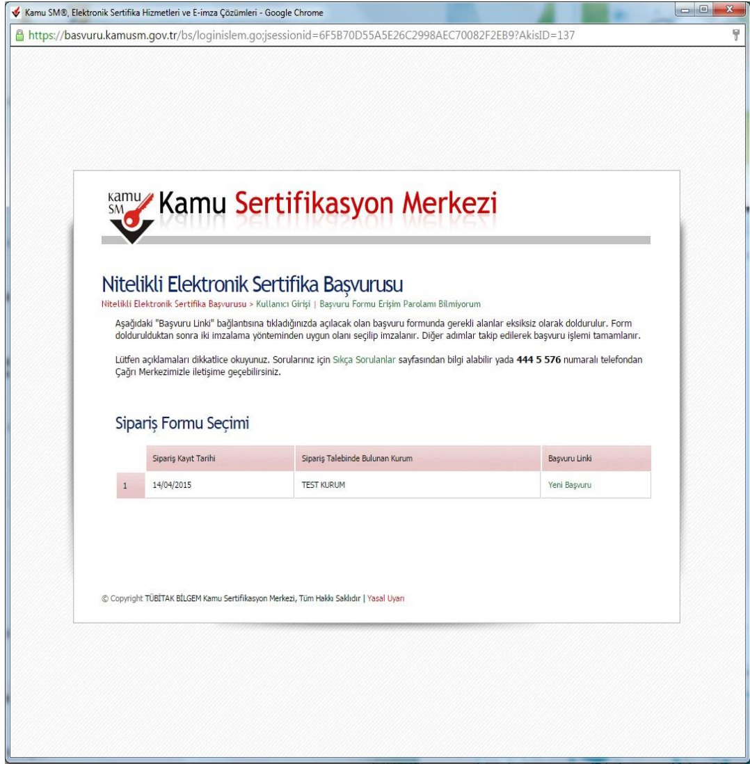
Őekil 3: SipariŐ Formu Seęimi

Doęru bilgilerle kullanıcı giriŐi yapıldıęında "SipariŐ Formu Seęimi" ekranı gelmektedir. İlk defa Nitelikli Elektronik Sertifika baŐvurusunda bulunmak için gelen listede "Yeni BaŐvuru" linkine tıklanmalıdır. Eęer daha önce form doldurulmuŐ ise ve güncelleme yapmak gerekiyorsa "Önceki BaŐvuru" linkine tıklanmalıdır (Bkz. Őekil 3).