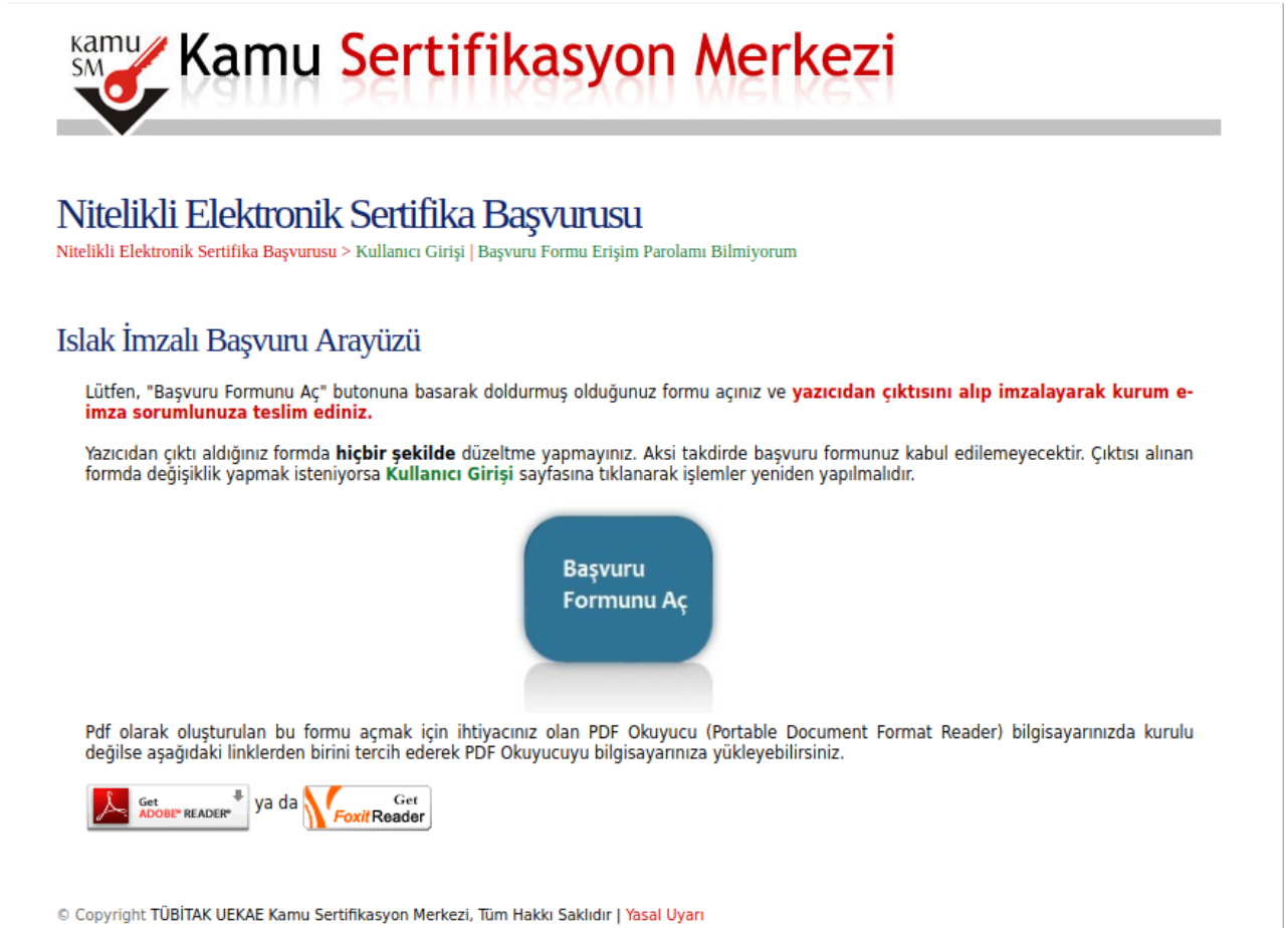
Őekil 8: NES Başvuru Formu Aç

Oluőturulan başvuru formu "Başvuru Formunu Aç" butonuna tıklanarak açılmalıdır. Başvuru formu PDF formatında oluşturulmaktadır. PDF olarak oluşturulan formu açabilmek için ihtiyaç duyulan PDF okuyucu Őekil 8'de verilen linklerden biri tercih edilerek yüklenebilir (Bkz. Őekil 8).