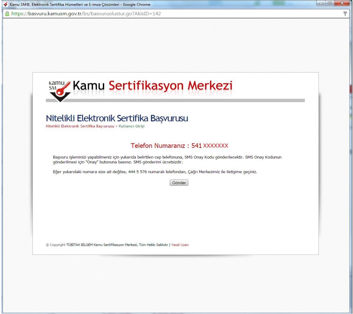
Şekil 5: Başvuru SMS Onayı

Başvuru işlemine devam edebilmek için başvuruda belirtilmiş olan cep telefonuna, SMS Onay Kodu gönderilmektedir. Gönderilen kod açılan sayfadaki kutuya yazılıp "Gönder" butonuna basılmalıdır (Bkz. Şekil ).